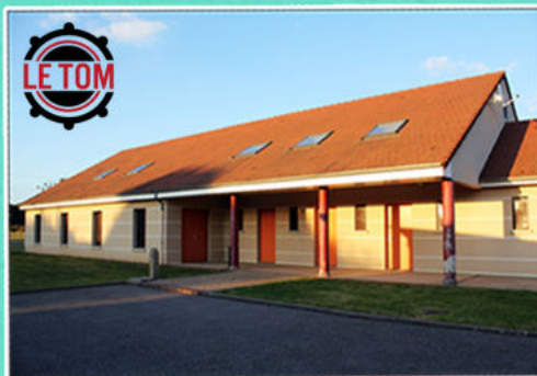
Le Tom Salle Associative, 33, route d'Abondant, 27710 Saint Georges Motel

Collation d'accueil et aux pauses offertes.